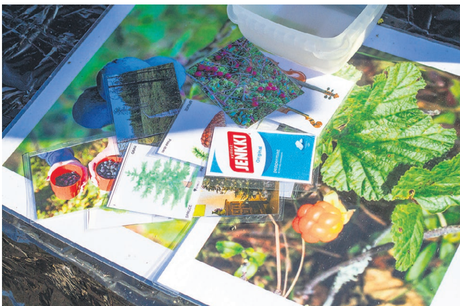
Metsäkeskuksen ja 4H-yhdistyksen rastilla pohdittiin, mitä luonnontuotteita metsässä on.