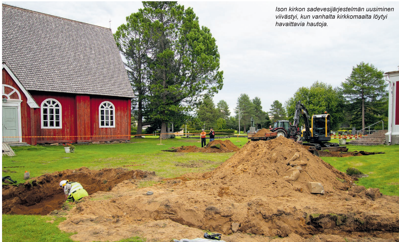
Ison kirkon sadevesijärjestelmän uusiminen viivästyi, kun vanhalta kirkkomaalta löytyi havaittavia hautoja.