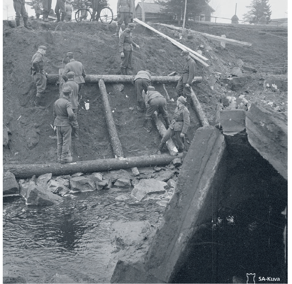
Siltaa rakennetaan Tervolassa saksalaisten tuhotyön jäljiltä