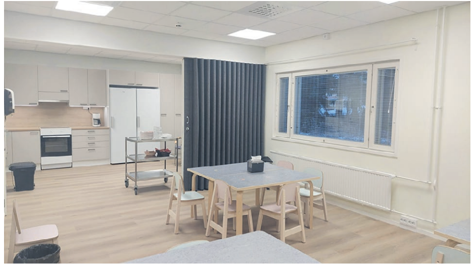
Monikäyttötilassa lapsiryhmä mahtuu hyvin syömään ja vaikkapa askartelemaan. Tilaa voi rajata paljeovella, jonka huopapinta parantaa akustiikkaa.

Varhaiskasvatuksen käytössä olevissa tiloissa on käynnissä monenlaisia muutoksia. Vekaroiden eli 4–5-vuotiaiden ryhmän entiset tilat Heikkelissä ovat nyt tyhjillään. Niihin tehdään pintojen siistimistä ja seinät maalataan saman värimaailman mukaan kuin juuri valmistuneissa tiloissa. Tulevaisuudessa tiloihin siirtyy ryhmäpäiväkodin lapsiryhmä. Entiseen pankkiholviin puikaistiin remontin yhteydessä oviaukko yhdistämään tiloja, ja tämä mahdollistaa tilojen monipuolisemman käytön.