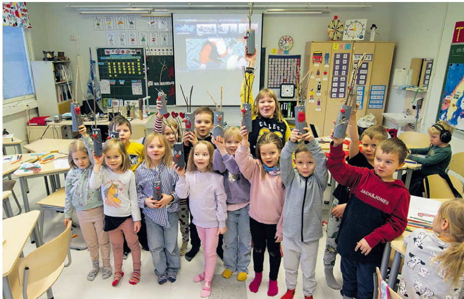
Mattisen koulun eskarit ja eka- ja tokaluokkalaisten tekivät joulutyöpajassa muun muassa puusen poron.

Mattisessa, Louella ja Kaisajoella oppilaat tekevät joulua kouluun harjoittelemalla joulujuhlaesityksiä ja askartelemalla ahkerasti.