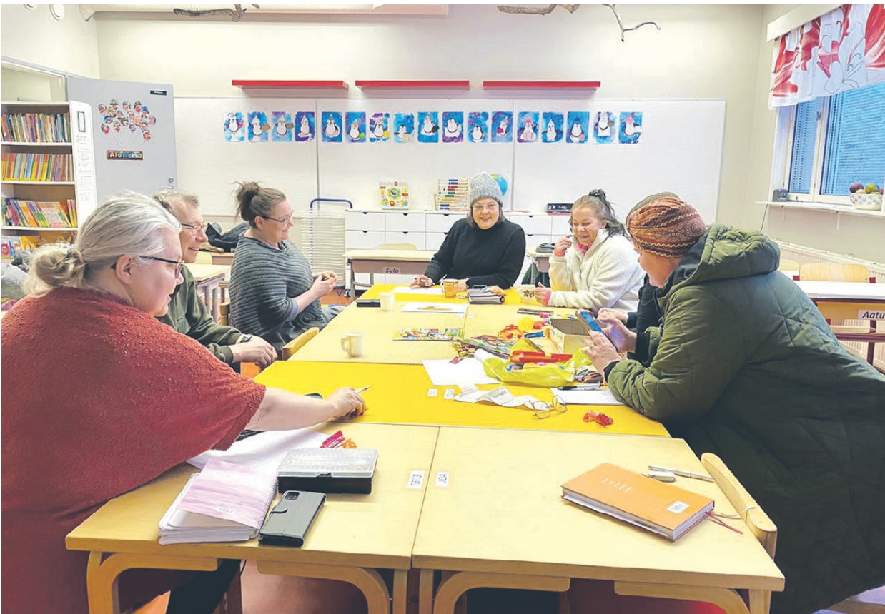
Vanhempainyhdistys kokoontuu Kaisajoen koululla suunnittelutöihin aina tarpeen tullen.

Teksti: Auni Vääräniemi