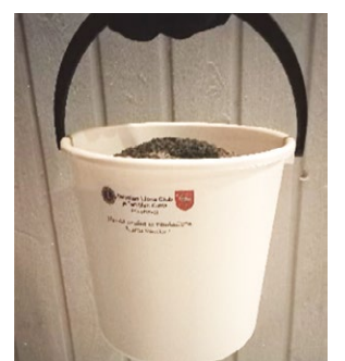
Hiekoitusämpäri valmiina jakoon

Viides- ja kuudesluokkalaisten lapsille järjestettiin Rauhanjulistikilpailu, jossa lapset saivat piirtää julisteen aiheesta ”Rauha ilman rajoja”. Kilpailu oli osa kansainvälistä rauhanjulistikilpailua. Kaikkiaan viidestäkymmenestä julisteesta valittiin viisi kilpailemaan lapin muiden lasten piirtämien julisteiden kanssa. Voittajat löytyi tällä kertaa Rovaniemeltä. LC Tervola palkitsi kaikki osal-