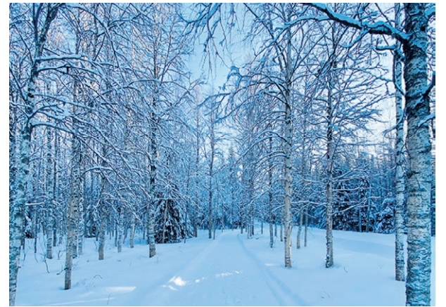
Kävelypolku kulkee ympyräreitteinä valaistun hiihtoladun lyhintä kierrosta mukailleen.

Uuden kävelyreitin toivotaan vähentävän viereisellä ladulla kävelemistä. Polku