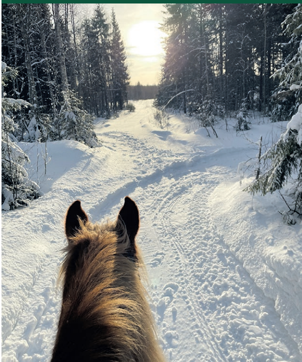
Suomenhevosen kanssa ratsailla aurinkoisella metsäpolulla. Kuva, toimitus

Lukijan kuva. Lähetä omasi osoitteeseen: aineisto@tervola-lehti.fi