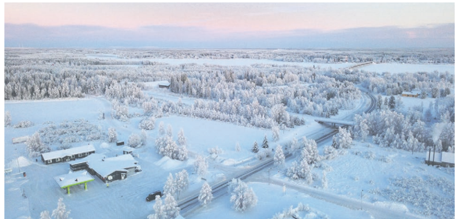
Osa alueen tonteista sijoittuu Siltatien pohjoispuolelle Tervakuksan läheisyyteen.

nykyisiä toimijoita kuin uusien yritysten sijoittumista kunnan omistamille, valmiiksi kaavoitetuille tonteille,” Mattinen summaa.