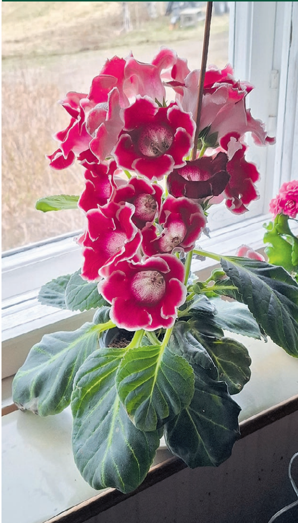
Gloksiinia kukkii kauniisti koleasta keväästä huolimatta.

Lukijan kuva. Lähetä ottamasi kuva aineisto@tervola-lehti.fi niin julkaisemme kuvia lehdessä.