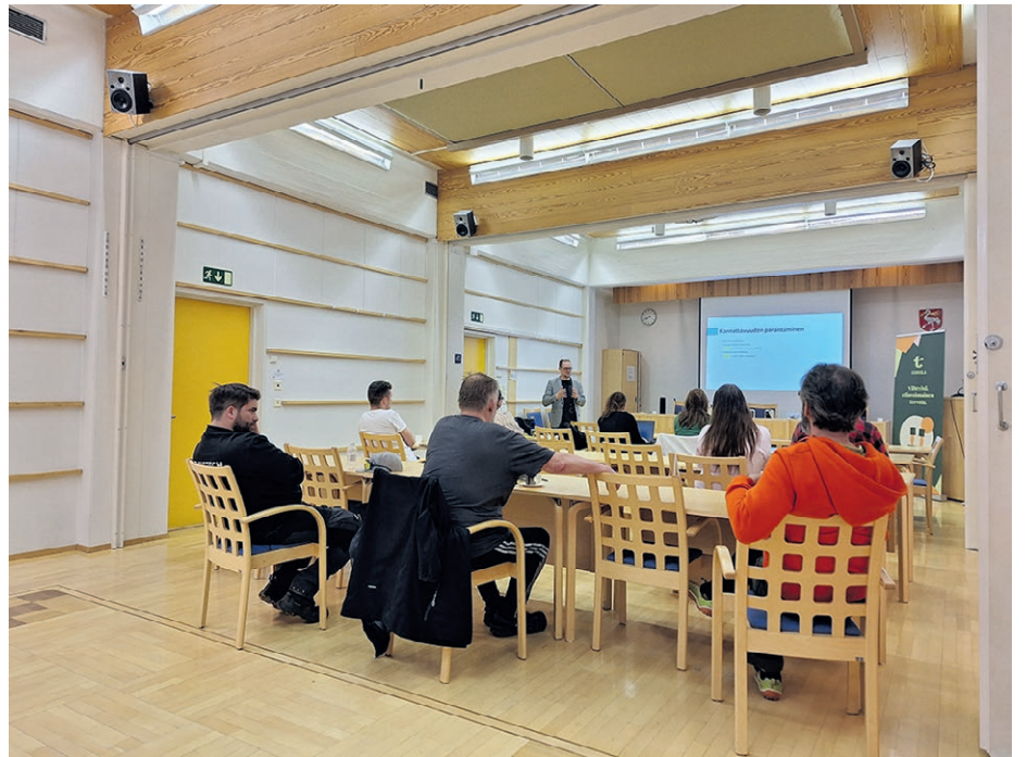
Tervolan Yrittäjäilta kokosi yhteen paikallisia yrittäjiä ja yritystoiminnasta kiinnostuneita. Illan teemana oli kannattavuus ja talouden ymmärtäminen selkokielellä.

Yrittäjäillat tarjoavat jatkossakin ajankohtaista tietoa, käytännön työkaluja ja ennen kaikkea kohtaamisia, jotka vahvistavat paikallista yrittäjämönäisyyttä. Seuraavista tapahtumista tiedotetaan Tervolan kunnan ja Tervolan Elinkeino-yhtiön eri viestintäkanavissa.