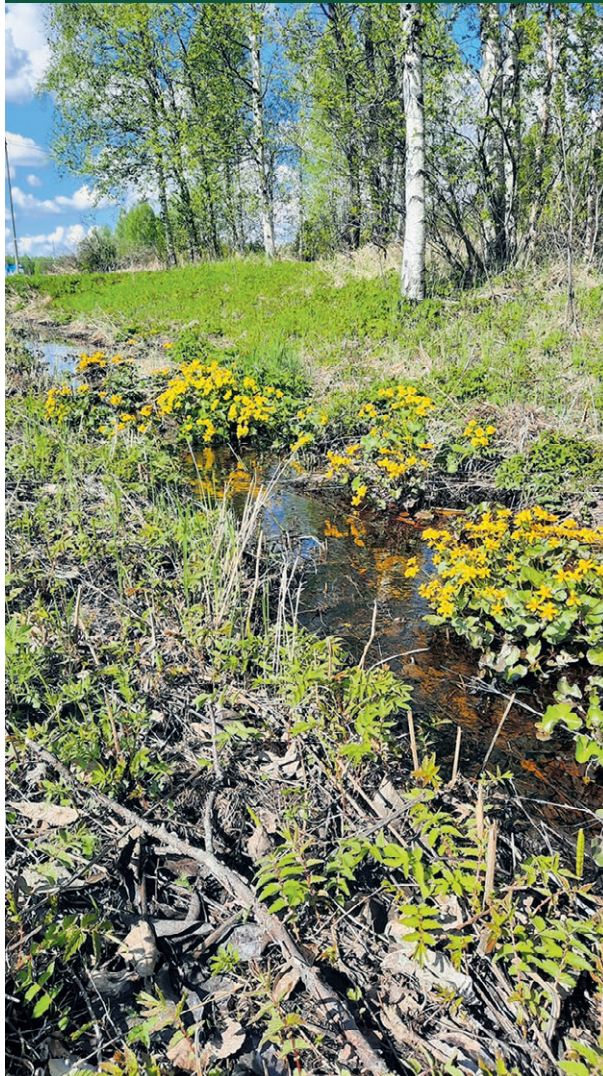
Kiehtovan kauniit Rentukat kukkivat houkuttelevan keltaisina ojan partaalla. lähettäjä Ari Saukko