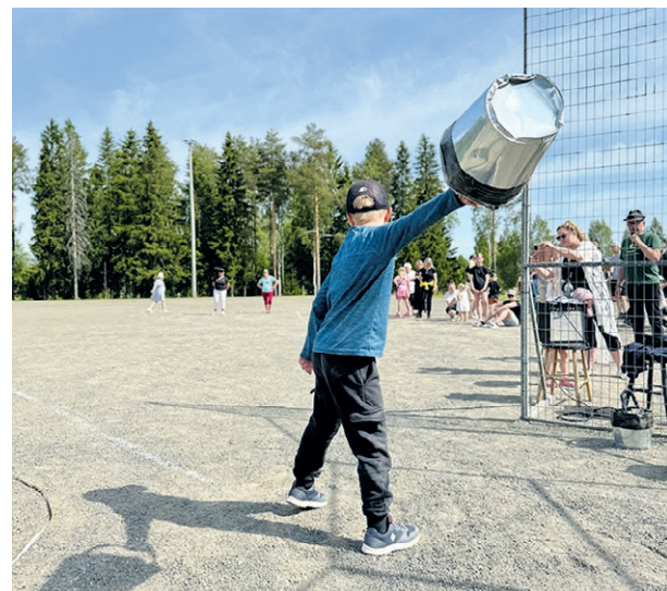
Ämpäriheitto on perinteinen osa tapahtumaa.