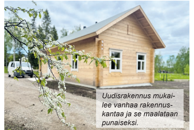
Uudisrakennus mukaillee vanhaa rakennuskantaa ja se maalataan punaiseksi.

Tänä kesänä museolla ahkeroidaan enimmillään kuusi työntekijää, joiden lisäksi museotoiminnan mahdol-