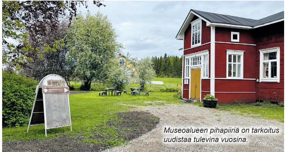
Museoalueen pihapiiriä on tarkoitus uudistaa tulevina vuosina.

Tervolan kotiseutumuseo tarjoaa monenlaista ohjelmaa ja tapahtumia kesän aikana. Ohjelmassa ovat muun muassa villiyrtykurssi sekä hiljaisen taiteen työpajat ja jo viime kesänä suurta suosiota niittäneet museon keskiviikot, joista jokaisella on oma teemansa. Museoalla palvelee myös lounasta tarjoava kesäkahvila, joka on museon tapaan avoinna tiistaista sunnuntaihin. Keski- viikkoiltoihin myös kahvilalla on pidennetyt aukioloajat. Heinäkuun alkupuolella museon pihapiirissä vietetään jo perinteeksi muodostunutta pitäjäjuhlaukseen, joka käynnistää myös Ämpäripääviikon.