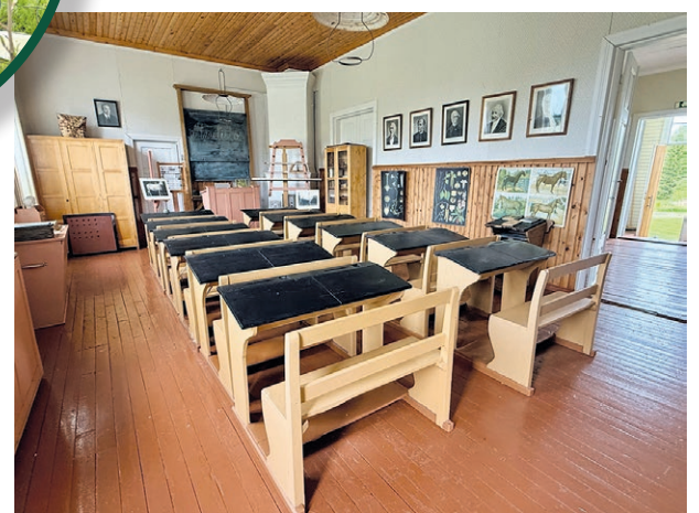
Museorakennuksiin lukeutuu myös Paakkolan vanha koulu

Museon omat lampaat viettävät kesää museon pihapiirissä.